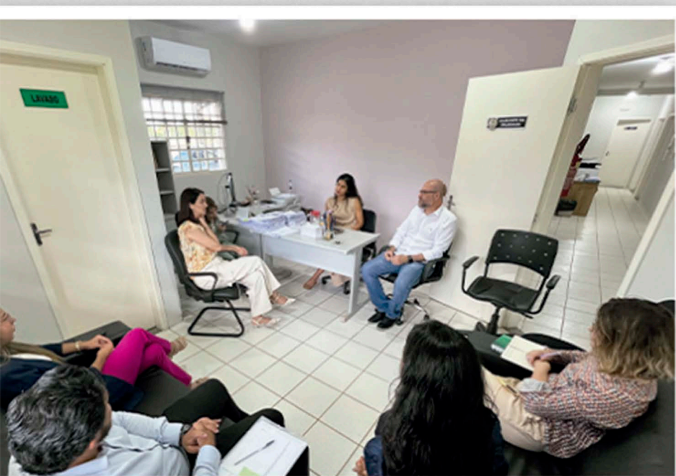
Reunião na delegacia da mulher

Em Dourados , a situação é ainda mais alarmante. A cidade registrou 167 casos de estupro de vulnerável em 2023, com uma taxa de 98,6 por 100 mil habitantes, a maior entre cidades com mais de cem mil moradores. Para crianças de 0 a 13 anos, o índice atinge 343,2 por 100 mil, o mais alto do Brasil.